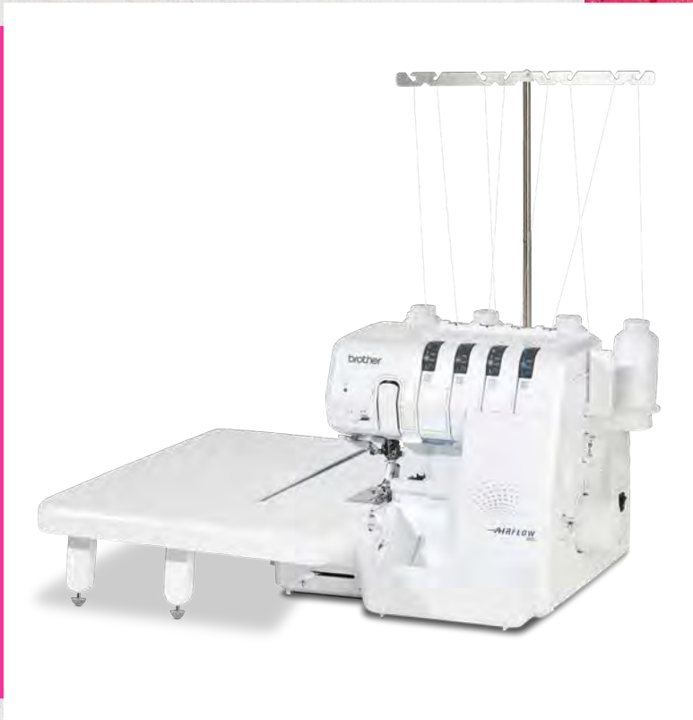
Optionaler Anstiehetisch (separater Kauf erforderlich)